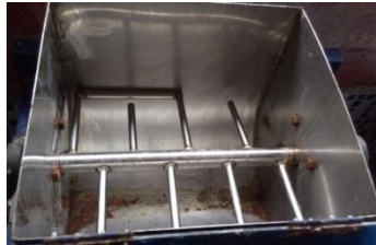
Gambar 4. Pengaduk/pengadon ampiang

Bagian pengaduk/pengadon ampiang berfungsi untuk mengaduk adonan ampiang supaya adonan menjadi rata. Adapun bentuk adonan dibuat bersirip dengan jarak sirip 1 dengan yang lainnya adalah 100 mm dan tinggi 120 mm terlihat dalam Gambar 4 dibawah: