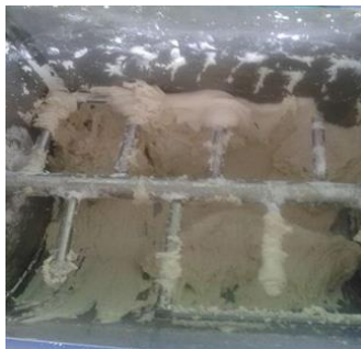
Gambar 5. Proses pengujian mesin pengaduk adonan

Pengujian mesin dilakukan untuk menguji apakah mesin sudah sesuai dengan tujuan yang diharapkan atau belum. Pengujian dilakukan di bengkel Polman Babel, hasil pengujian terlihat dalam Gambar 6 :