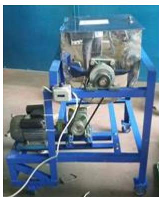
Gambar 3. Pembuatan akhir mesin pengaduk adonan ampiang

Sedangkan hasil pembuatan akhir mesin sesuai rancangan terlihat pada gambar 4 dibawah.