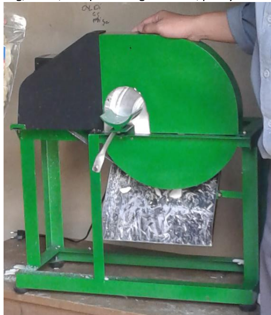
Gambar 2 Mesin pengiris singkong

Pada tahap berikutnya adalah perakitan komponen-komponen mesin yang telah dibuat sesuai dengan gambar kerja yang sudah ada. Proses assembling dimulai dari pemasangan dan pengelasan kerangka mesin, poros, alat potong, cover , dan pemasangan motor, pulley .