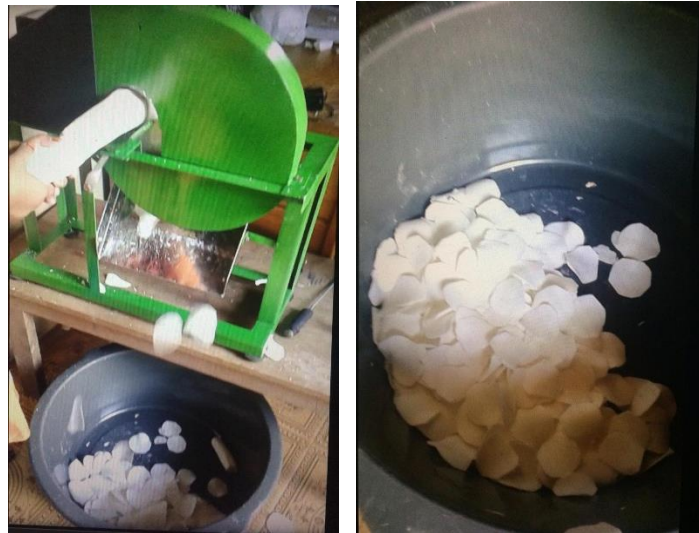
Gambar 3 Proses Uji Coba Pematangan

Setelah alat selesai dirakit dilakukan proses uji coba alat. Proses uji coba mesin dilakukan 2 (dua) tahap, yaitu proses pertama ujicoba tanpa beban dan tahap kedua uji coba dengan menggunakan beban yaitu dengan mengiris singkong yang digunakan untuk membuat kripik singkong. Berdasarkan hasil uji coba mesin mampu mengiris singkong dalam waktu 1 menit seberat 1,6 kg. Selain dari itu, hasil ketebalah irisan yang didapat seragam dan dapat mengiris dengan ketebalan 1,5 mm sesuai dengan keinginan mitra.