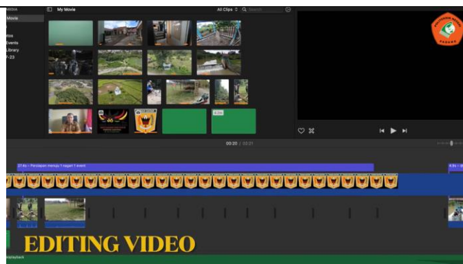
Gambar 4. Editing Video