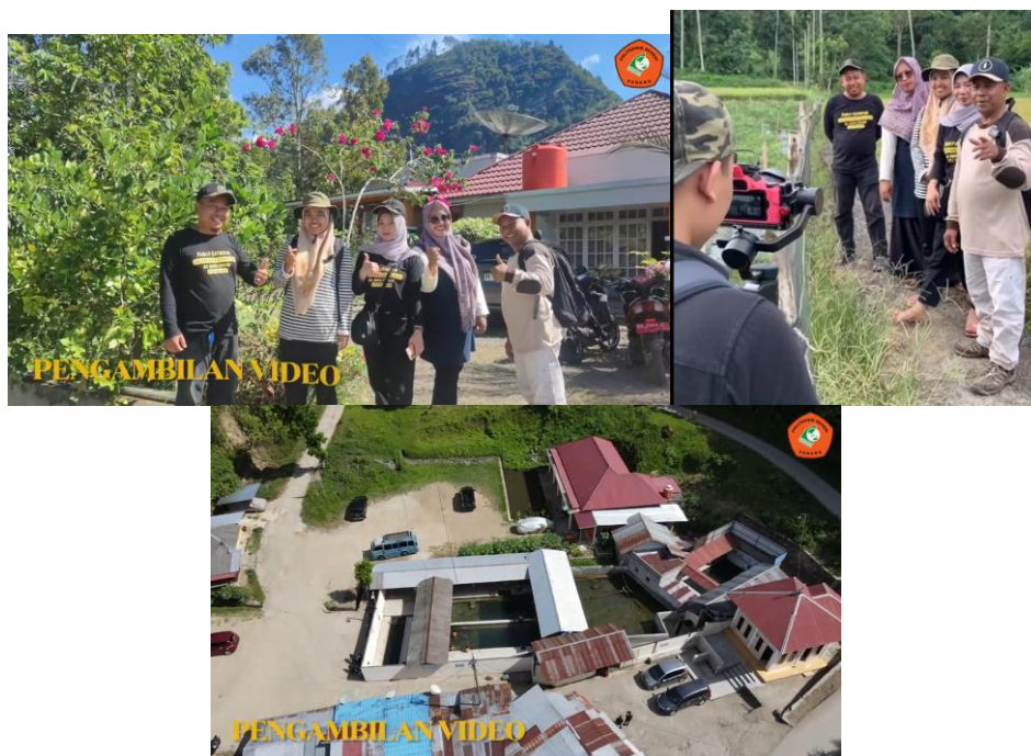
Gambar 3. Pembuatan Video Profil

Pembuatan video dilakukan pada tanggal 4 Juni 2023. Pengambilan video dilakukan menggunakan kamera dan drone untuk dari udara. Pengambilan video didampingi oleh Wali Nagari dan Perangkat serta Pokdarwis Nagari Padang Ganting. Pengambilan video dimulai dari Air Terjun 7 Tingkat, Batu Jajak Nabi, Makam Tuan Khadi, Makam Syech Ibrahim dan berakhir pada Aia Angek. Proses proses pembuatan video profil dapat dilihat pada Gambar 3.