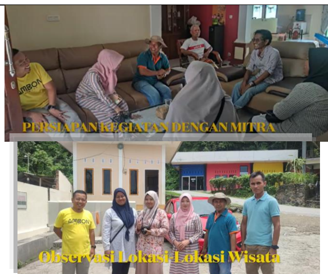
Gambar 2. Observasi Lokasi dan Diskusi