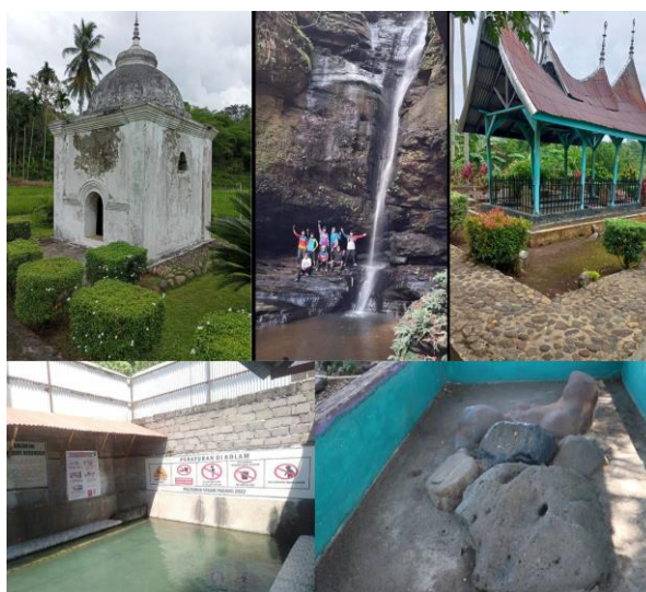
Gambar 1. Objek Wisata di Nagari Padang Ganting

Selain objek wisata pemandian air panas, nagari Padang Ganting juga memiliki situs sejarah yaitu makam Syekh Ibrahim dan makan Tuan Kadhi yang terletak di jorong Koto Gadang. Pada jorong Rajo Dani juga terdapat objek wisata batu jajak Nabi dan air terjun 7 tingkat. Gambar objek-objek wisata yang ada di nagari Padang Ganting dapat dilihat pada Gambar 1.