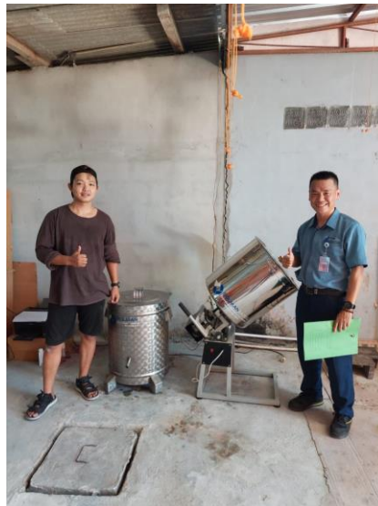
Gambar 6. Pengabdian Berfoto Dengan Mitra

Ketua pengabdian berfoto dengan mitra dapat dilihat pada Gambar 6. Mesin pengaduk bumbu keripik singkong merupakan pengembangan dalam menunjang proses produksi mitra. Dimana sebelumnya mitra mendapatkan mesin pengering minyak keripik singkong.