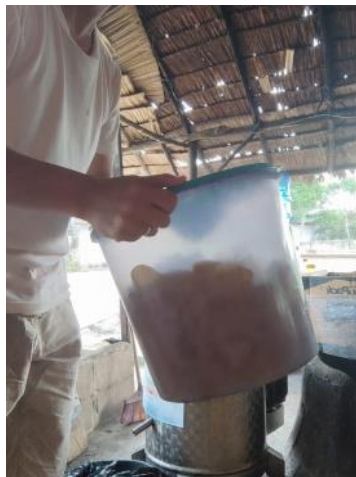
Gambar 1. Proses Pengadukan Bumbu Keripik Singkong Dengan Manual

Dari hasil survei dan analisis Bersama dengan mitra, permasalahan yang dihadapi oleh usaha keripik singkong milik bapak ilham dalam pembuatan keripik singkong yaitu mengenai persoalan proses produksi. Salah satunya dalam proses pengadukan bumbu keripik singkong masih menggunakan secara manual (Gambar 1) dengan menggunakan wadah atau baskom yang telah disediakan kemudian di aduk bersamaan dengan bumbu. Dalam proses ini menyebabkan menguras tenaga dan waktu karena proses masih menggunakan manual. Proses pengadukan bumbu keripik singkong dengan total pengadukan untuk keripik singkong 8 ons membutuhkan waktu 2 menit.