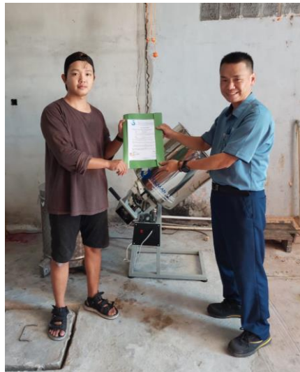
Gambar 4. Proses Serah Terima Mesin Pengaduk Keripik Singkong

Proses serah terima mesin pengaduk bumbu keripik singkong dilakukan langsung di tempat mitra dapat dilihat pada Gambar 4.