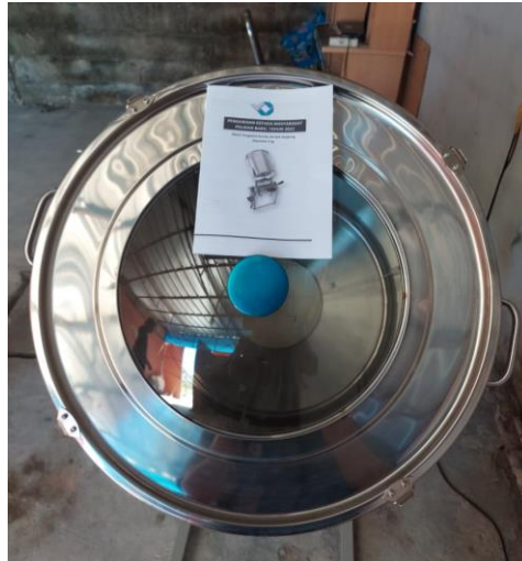
Gambar 3. Buku Panduan Mesin Pengaduk Bumbu Keripik Singkong

Proses serah terima mesin pengaduk bumbu keripik singkong dilakukan langsung di tempat mitra dapat dilihat pada Gambar 4.