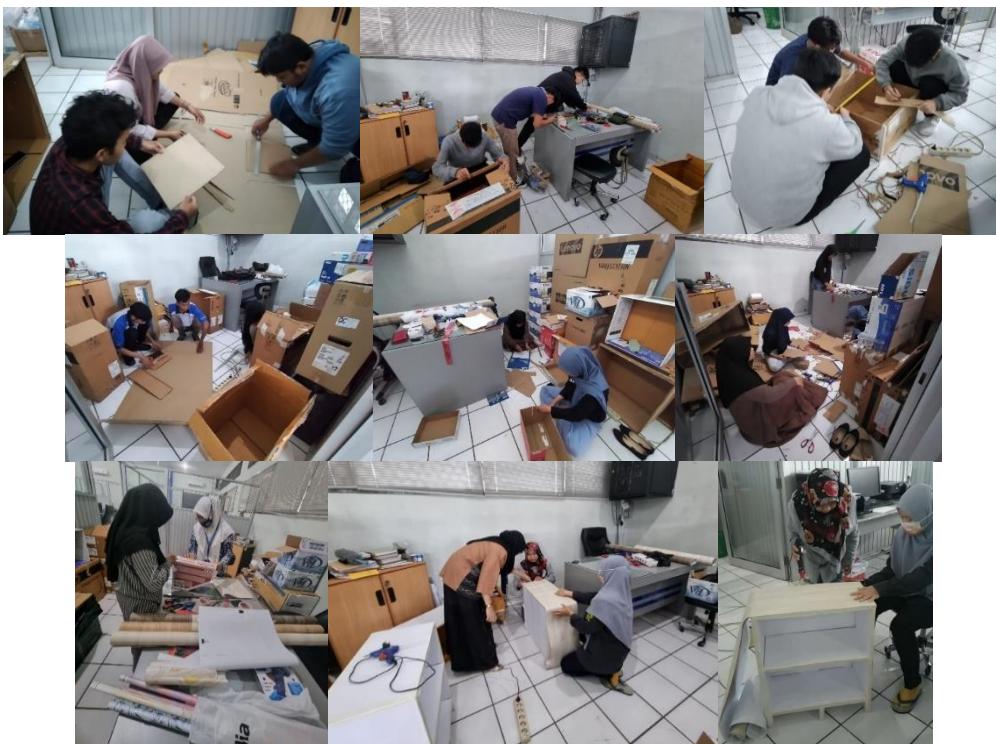
Gambar 5. Workshop Kelas Kreasi

Rak UKS dibuat sebanyak 4 (empat) set. Workshop kelas kreasi ditunjukkan pada Gambar 5 dan Rak UKS hasil kelas kreasi ditunjukkan pada Gambar 6.