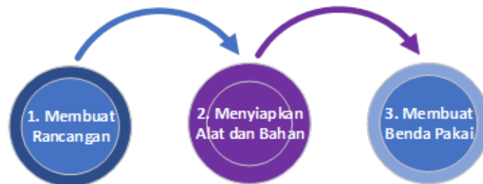
Gambar 2. Tahapan Pelaksanaan Kelas Kreasi

Metode pengelolaan sampah kardus yang diterapkan dalam proyek ini dimulai dengan mengumpulkan sampah kardus yang ada di sekitar lingkungan Polman Negeri Babel dan pelaksanaan kelas kreasi. Kelas kreasi diikuti oleh mahasiswa prodi Teknik Perancangan Mekanik yang masuk ke dalam mata kuliah IIS ( Intrapersonal dan Interpersonal Skills ) sebagai implementasi kegiatan MBKM (Merdeka Belajar Kampus Merdeka). Adapun tahapan pelaksanaan kelas kreasi ditunjukkan pada Gambar 2. Tahap awal adalah membuat rancangan. Rancangan dibuat menggunakan software AutoDesk Inventor sesuai dengan tema dan bentuk desain yang diinginkan. Tahap kedua adalah menyiapkan alat dan bahan. Bahan yang digunakan untuk membuat benda pakai adalah kardus ( corrugated box ) jenis single dan double wall corrugated , kertas gambar bekas, kertasive , wallpaper , kertas kado, akrilik, lem, selotif, dan amplas. Alat yang digunakan adalah pensil, rol meter, mistar baja, cutter , gunting, lem tembak, cape dan hot gun . Tahap ketiga adalah membuat benda berdasarkan rancangan dan instruksi kerja.