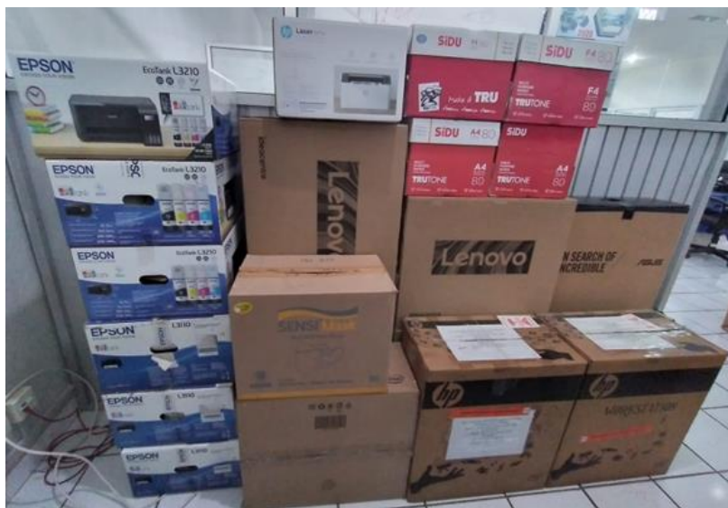
Gambar 1. Sampah Kardus Polman Negeri Babel

Sampah kardus seperti kotak bekas komputer PC, CPU, printer , AC, kertas dan barang-barang kantor lainnya (Gambar 1) banyak dijumpai di kampus Politeknik Manufaktur Negeri Bangka Belitung (Polman Negeri Babel) yang dihasilkan dari kegiatan pengadaan/ pembelian barang. Untuk mengurangi sampah kardus tersebut perlu dilakukan pengelolaan sampah melalui penggunaan kembali sampah kardus tersebut dan dijadikan benda pakai.