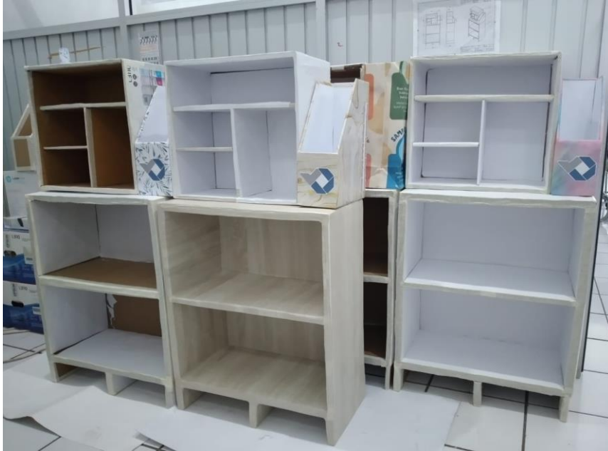
Gambar 6. Rak UKS Hasil Kelas Kreasi

Partisipasi satuan pendidikan dalam pelaksanaan program pengabdian ini adalah sebagai mitra sosialisasi tentang pentingnya menjaga kelestarian lingkungan sehingga paham mengenai dampak yang ditimbulkan dari menumpuknya sampah dan pemanfaatan sampah merupakan alternatif pilihan kreasi seni sebagai bentuk kecermatan dalam menangkap peluang dan kepekaan terhadap lingkungan yang ada disekitarnya.