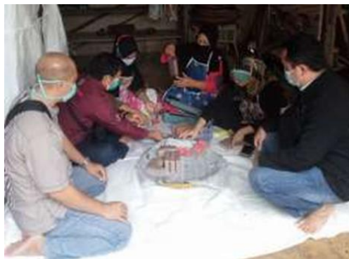
Gambar 1. Observasi proses produksi mitra

Tujuan dari kegiatan ini adalah untuk melihat secara langsung proses produksi pembuatan terasi udang di tempat usaha kedua mitra. Aspek penting dalam kegiatan ini yaitu spesifikasi teknis mesin teknologi tepat guna yang akan diterapkan di proses produksi mitra dan sistem pemasaran yang akan digunakan oleh mitra. Kegiatan observasi dan diskusi dilakukan antara tim pelaksana dengan mitra seperti yang ditunjukkan pada Gambar 1.