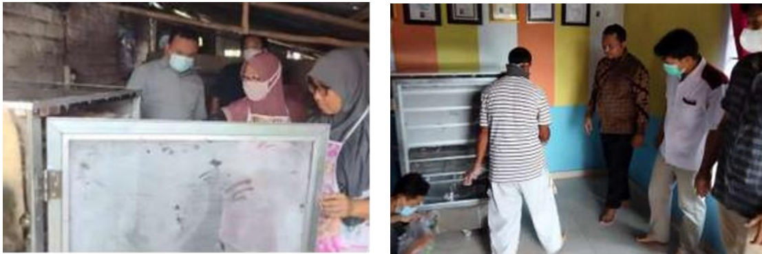
(a) Pemantauan produksi mitra kesatu (b) Pemantauan produksi mitra kedua Gambar 7. Pendampingan produksi mitra

Kegiatan ini dilakukan untuk mengetahui kendala-kendala yang dihadapi oleh mitra setelah pelatihan dilakukan (Kurniawan dan Subhan, 2021). Dalam hal ini, tim pelaksana mendampingi mitra dalam menyelesaikan permasalahan-permasalahan yang ada di lapangan. Kegiatan pendampingan kepada mitra dapat dilihat pada Gambar 7.