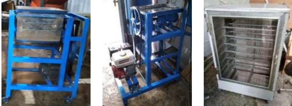
(a) Perakitan mesin pengaduk (b) Perakitan mesin penggiling (c) Perakitan oven pengering Gambar 3. Hasil perakitan mesin

Dari gambar diatas, jenis mesin yang dirancang yaitu Gambar 2.a rancangan mesin pengaduk udang dengan garam, Gambar 2.b rancangan mesin penggiling udang/terasi, Gambar 2.c rancangan oven pengering udang/terasi. Gambar rancangan dalam bentuk tiga dimensi selanjutnya dibuat gambar susunan dan gambar bagian yang berfungsi sebagai acuan dalam pembuatan dan perakitan komponen di bengkel mekanik. Proses pembuatan komponen mesin teknologi tepat guna dilakukan menggunakan mesin bubut, mesin frais, mesin bor, mesin pemotong plat, gerinda. Komponen-komponen yang telah dibuat tersebut dirakit menggunakan peralatan seperti kunci dan juga mesin las. Mesin teknologi tepat guna yang telah dirakit dapat dilihat pada Gambar 3.