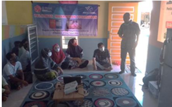
Gambar 5. Pelatihan pemasaran

Tahap ini bertujuan untuk membekali kedua mitra dalam membuat dan mengelola sistem pemasaran online. Media online yang sudah tersedia dimanfaatkan untuk menjual produk terasi udang yang dihasilkan mitra sehingga dapat dikenal oleh masyarakat secara luas. Kegiatan pelatihan dapat dilihat pada Gambar 5.