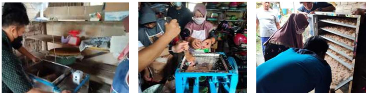
(a) Penggunaan mesin pengaduk (b) Penggunaan mesin penggiling (c) Penggunaan oven pengering Gambar 4. Pelatihan ke mitra

Mesin teknologi tepat guna yang telah diuji coba selanjutnya diberikan ke mitra untuk dipakai pada produksi pembuatan terasi udang. Sebelum digunakan oleh mitra dan karyawan, tim pelaksana melakukan pelatihan pengoperasian dan perawatan terlebih dahulu (Masdani dan Ariyanto, 2021). Kegiatan pelatihan tersebut seperti yang ditunjukkan pada Gambar 4 berikut ini: