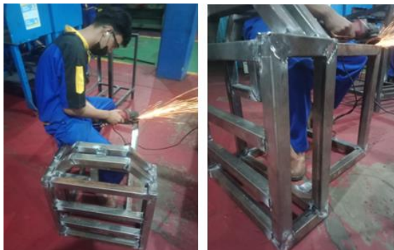
Gambar 3. Proses pembuatan mesin