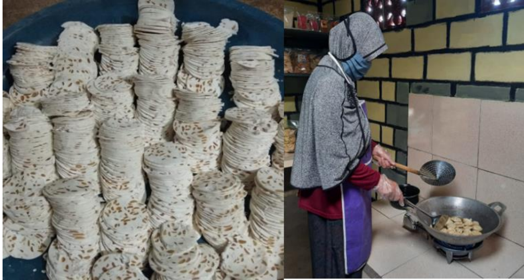
Gambar 1. Foto kegiatan mitra pelaku usaha kelompok pelangi

terjadi peningkatan jumlah produksi sebesar 150% (Annisa Kesy Garside, Sudjtmiko, 2016). Pada kegiatan pengabdian yang sudah dilakukan sebelumnya yaitu oleh Kurriawan dan Annisa, salah satu unsur meminimalisir kecelakaan kerja pada sistem mesin perajang keripik terletak pada pelindung tangan saat dilakukan proses pengirisan (Pranata, Kurniawan B. Ghufron, M. Sulistyanto, M.P.T, 2018 dan Garside, Annisa Kesy & Sudjtmiko, 2016).