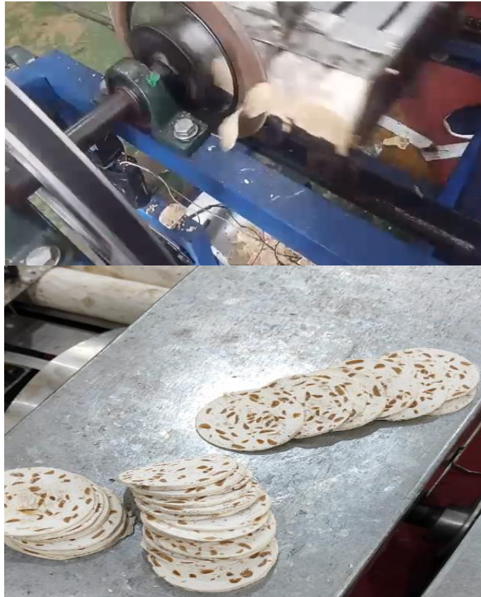
Gambar 4. Hasil pemotongan pengujian